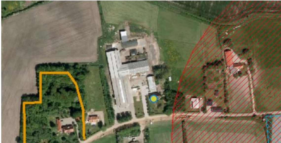
Vestermarksvej 20, Ribe. De røde linjer betyder kirkebeskyttelseslinjer