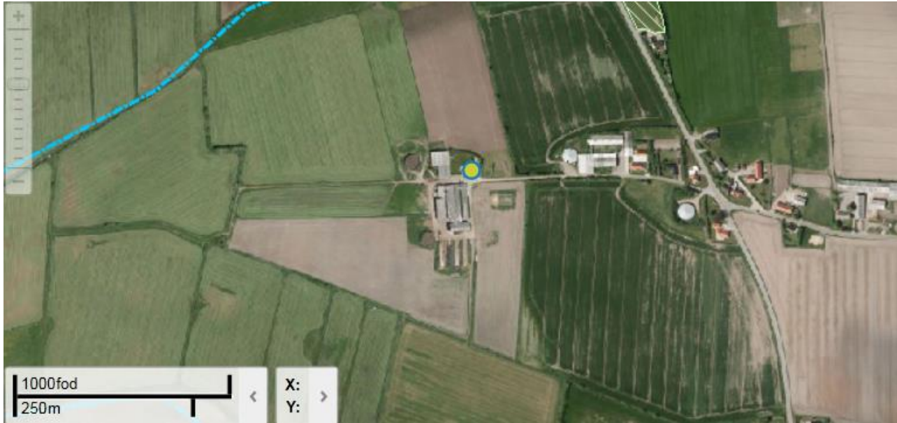
Hessellundvej 8, Ribe